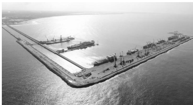
Vista aérea do Porto do Pecém.

25. O Complexo Industrial e Portuário do Pecém tem gerado impactos significativos na economia de São Gonçalo do Amarante.